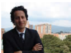
“Espero que separar en la fuente se vuelva una cos...”

“Las innovaciones en materia de reciclaje se están viviendo en América Latina. Los europeos están empezando a llamarnos para que les contemos cómo estamos concibiendo el tema porque sus sistemas de aseo utilizan mucha incineración como método de manejo de residuos que compiten con el reciclaje. En el contexto latinoamericano el país más avanzado, con la política pública y los incentivos más favorables, es Brasil”, precisó Valencia.