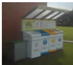
Estaciones de Reciclar tiene valor....

Esta iniciativa, que enmarca el Proyecto Mariposa, propende por la dignificación de la labor de los recicladores, su seguridad y eficiencia, y por la validación del esfuerzo realizado por los consumidores que separan el material en la fuente.