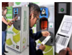
Máquina del Proyecto Mariposa.

cambio de los envases, se les de un incentivo monetario a los consumidores. El piloto se extenderá hasta finales de marzo de 2012, cuando se evaluará su viabilidad económica y el impacto que pueda generar para la industria a nivel de recuperación y logística.